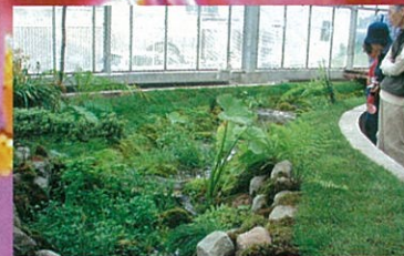
ホテルのせせらぎ