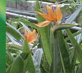
ゴクラクチョウカ