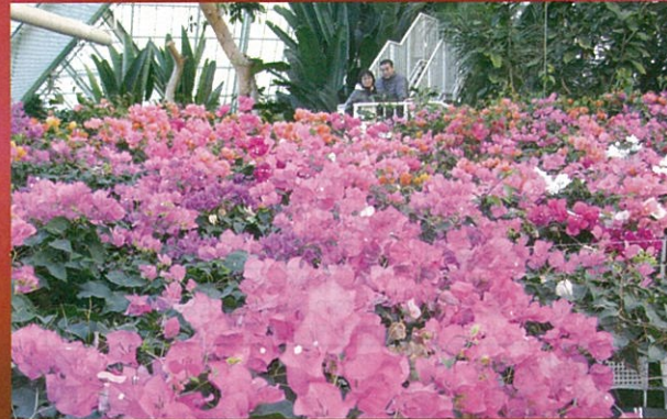
ブーゲンビレアの花壇

温室内では、ブーゲンビレアやハイビスカス、エンジェルトランペットの花が年中咲いています。