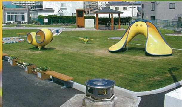
前庭の遊具とぬくもりベンチ(写真手前)

温室内では、ブーゲンビレアやハイビスカス、エンジェルトランペットの花が年中咲いています。