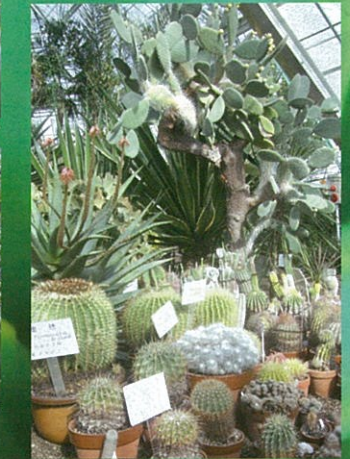
金鱗と団扇サボテン