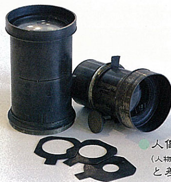
● 人像用鏡玉 (人物撮影用レンズ) と差込み絞り

This is the first and most important preserved photograph in Japan.